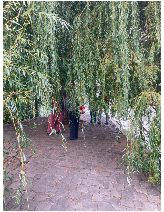
The filter (Square du Vert-Galant)