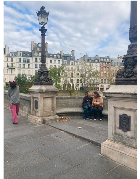
Embracing niche at a trafficked bridge