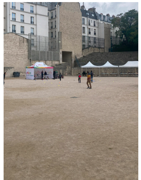
The open enclosed (Arènes de Lutèce)