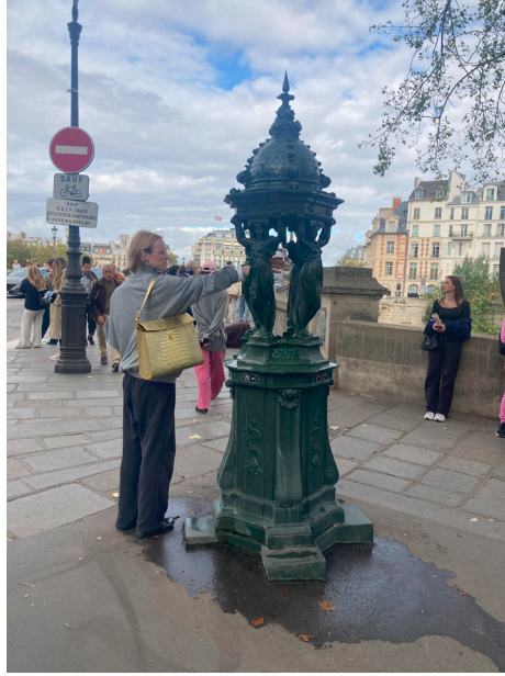
Gathering around commons (Parc de la Villette + Wallace water fountain)