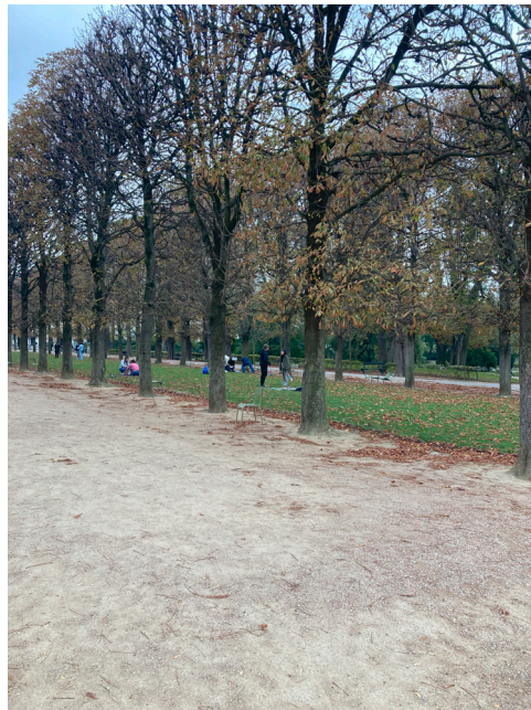
The edge (Parc des Buttes-Chaumont + Jardin du Luxembourg)