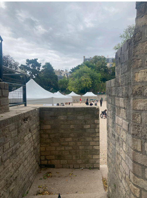
The unrevealed (Arènes de Lutèce)